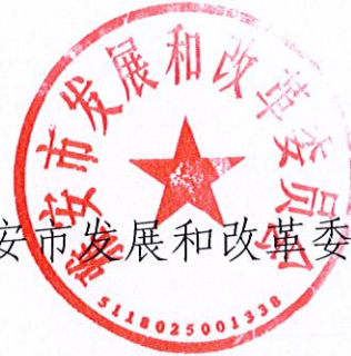
雅安市发展和改革委员会