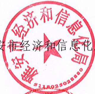
雅安市经济和信息化局