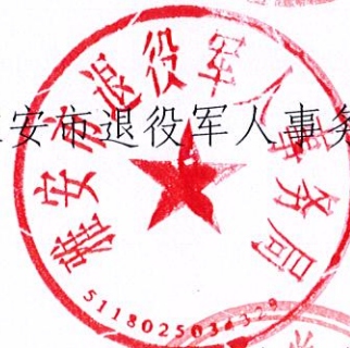
雅安市退役军人事务局