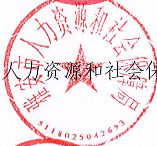
雅安市人力资源和社会保障局